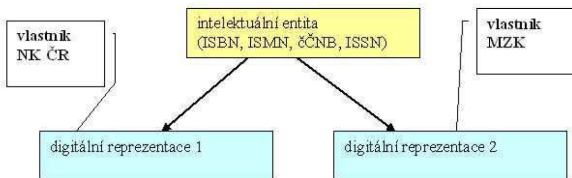
Obrázek 3: Popis vztahů mezi intelektuální entitou a digitální reprezentací.

Jedna intelektuální entita může být reprezentována jak pouze jedním digitálním dokumentem, tak více digitálními dokumenty. Jeden digitální dokument musí být lokalizován prostřednictvím jedné nebo více digitálních instancí.